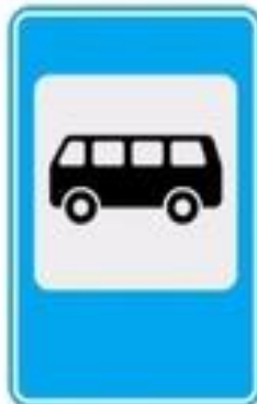
Место остановки автобуса и троллейбуса