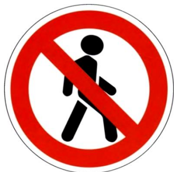
Движение пешеходов запрещено