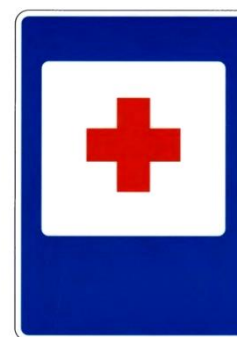
Пункт первой помощи